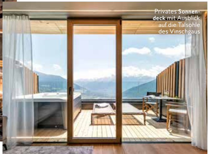
Privates Sonnendeck mit Ausblick auf die Talsohle des Vinschgaus

Das Gefühl von Weite hat man hier auch drinnen im Spa