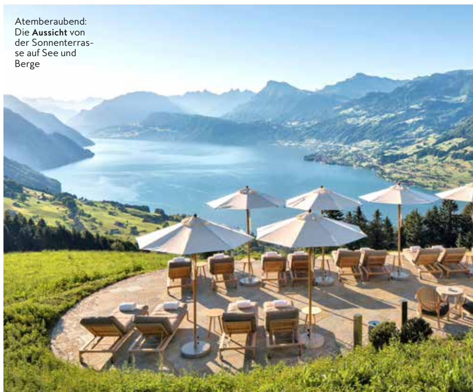
Atemberaubend: Die Aussicht von der Sonnenterrasse auf See und Berge