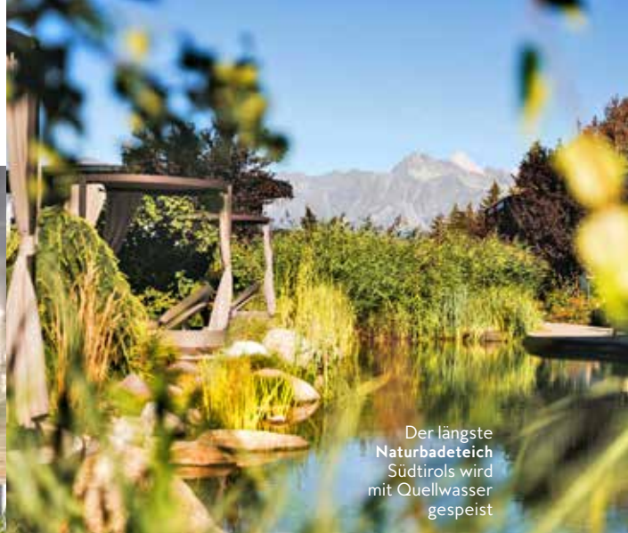
Der längste Naturbadeteich Südtirols wird mit Quellwasser gespeist