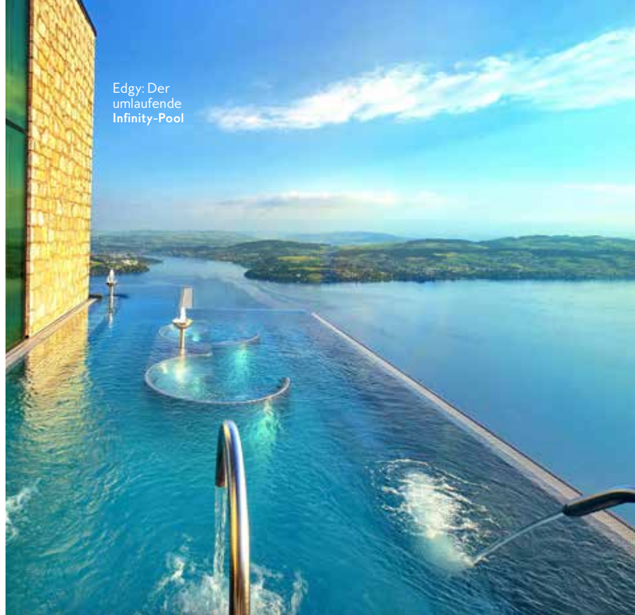
Edgy: Der umlaufende Infinity-Pool

Vor dieser Traumkulisse haben sich schon Film-Legenden wie Sean Connery, Audrey Hepburn und Sophia Loren treiben lassen: tagsüber im Infinity-Outdoor-Pool, schwindelerregende 500 Höhenmeter über dem Vierwaldstättersee und abends dann im berühmt-berüchtigten Privatclub des Hotels, der zum 10.000 Quadratmeter großen Alpine-Spa-Bereich umgebaut wurde. Die weitläufige Sauna- und Poollandschaft kann es easy mit jeder Luxus-Therme aufnehmen. Tipp: Auch Day Spa Gäste sind immer herzlich willkommen. Preis: DZ ab 650 Euro; burgenstockcollection.com