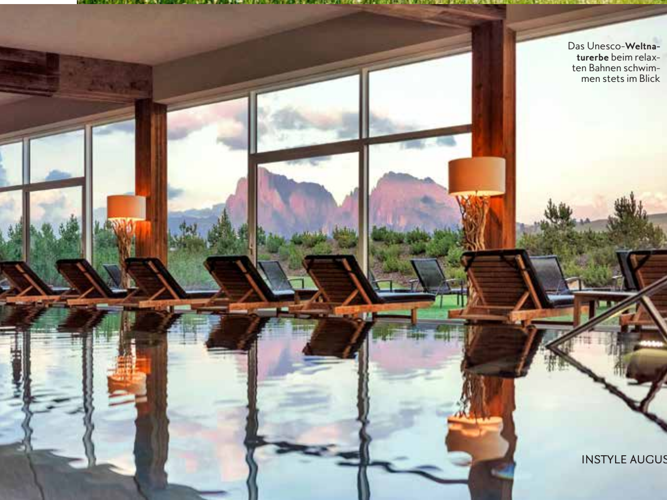
Das Unesco-Weltkulturerbe beim relaxten Bahnen schwimmen stets im Blick