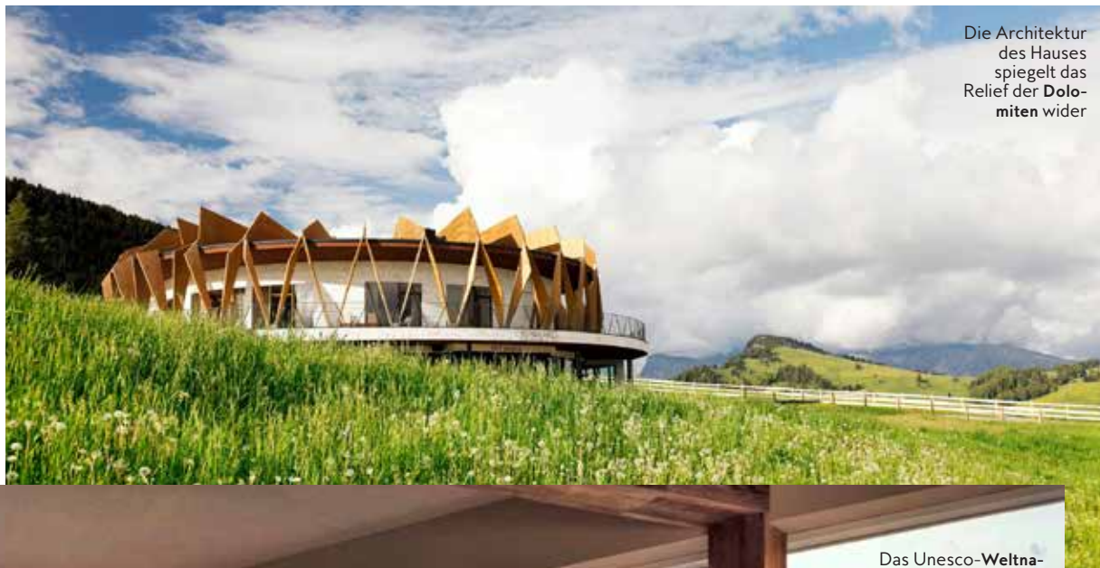
Die Architektur des Hauses spiegelt das Relief der Dolomiten wider

„Alpina Dolomites Lodge“, die sich mit ihrer zackigen Architektur stylish in Plattkofel, Langkofel, Schlern und Sellagruppe einreihet. Nach einem Tag an der frischen Luft: buchen Sie im Spa das entschlackende Signature-Treatment, bei dem die trockengebürstete Haut mit Ziegenmilch und Tannenölen verwöhnt wird. Preis: DZ für zwei P. ab 450 Euro inkl. Frühstück; alpinadolomites.it