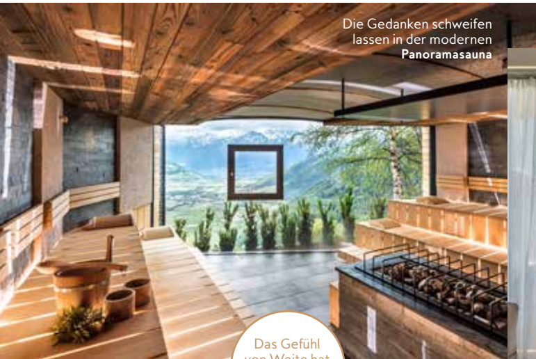
Die Gedanken schweifen lassen in der modernen Panoramasauna

Das Gefühl von Weite hat man hier auch drinnen im Spa