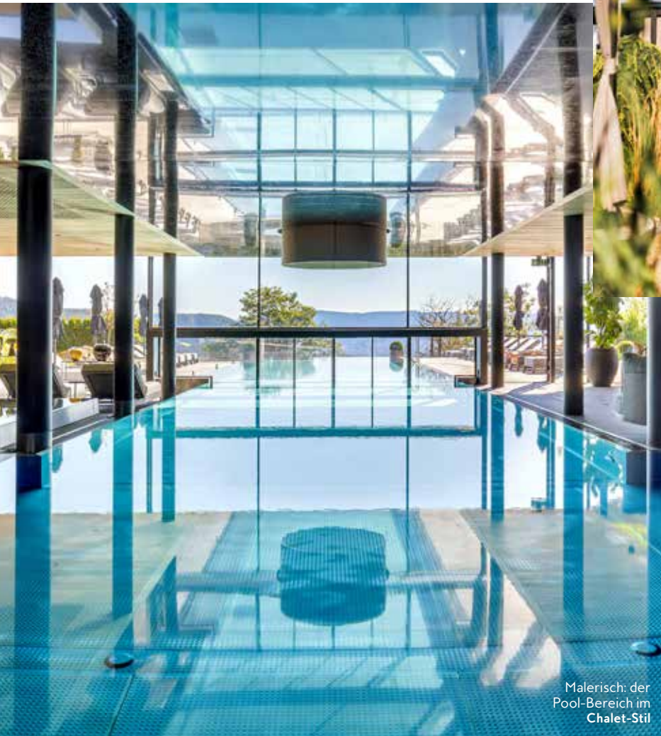
Malerisch: der Pool-Bereich im Chalet-Stil